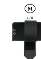
ERGO / FLEX